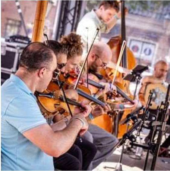
Amsterdams Andalusisch Orkest