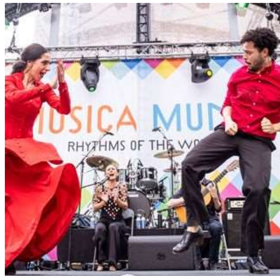
Primos del Norte met dansers