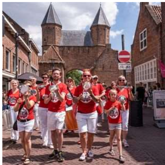
Parade met Bloco033