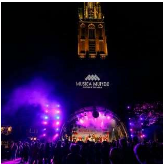
Blik op het podium onder de toren