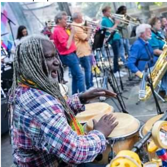
Manhattan Big Band met gastartiesten