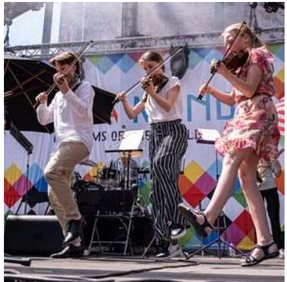
Vioollab Strings Ensemble